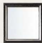
Mirilla rectangular con vidrio Corta-Fuegos

Por la importancia de este accesorio, sus características se detallan en la página contigua.