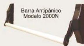
Barra Antipánico Modelo 2000N

Las barras antipánico , permiten la apertura inmediata de la puerta.