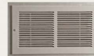
Detalle de la Rejilla